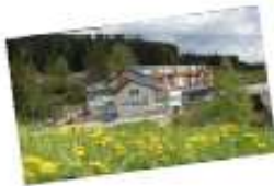
Hotel Grimmingblick Vitalhotel Styria

Die Kinderaktion 2018 gilt NUR für die u.a. Destinationen von 01. Juni bis 30. September 2018: