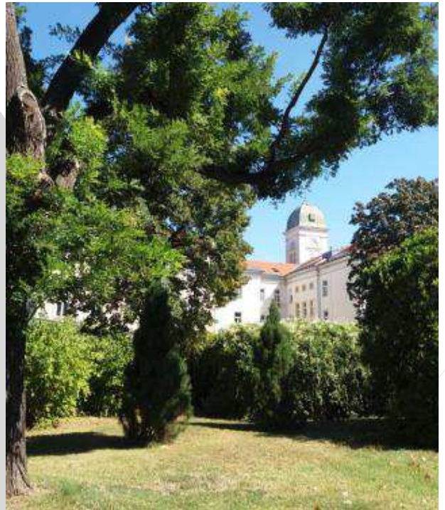
KFJ – Preyer – GZ Favoriten