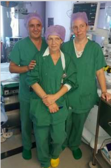
Kolleginnen des OP – Teams bei der Arbeit